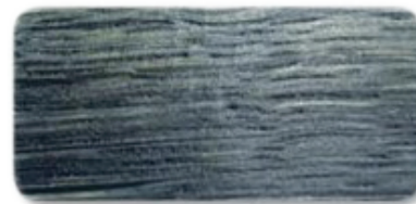
WS 114 Ocean Blue