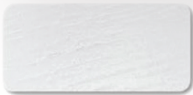
WS 100 White