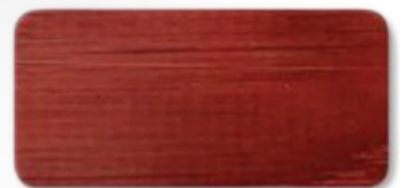
WS 125 Red