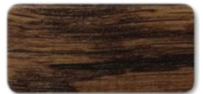
WS 192 Walnut