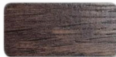
WS 196 Wenge