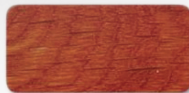
WS 169 Orange