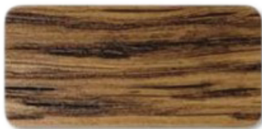
WS 133 Oak