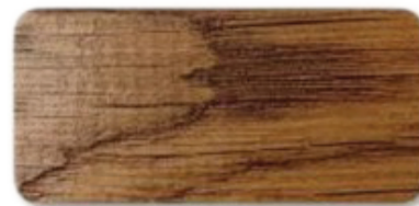
WS 143 Dark Nut