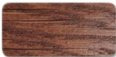
WS 152 Mahogany