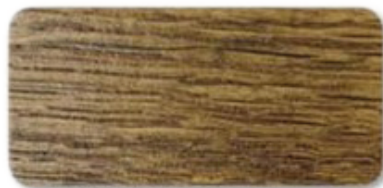
WS 151 Dark Oak