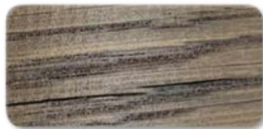
WS 184 Antique Walnut