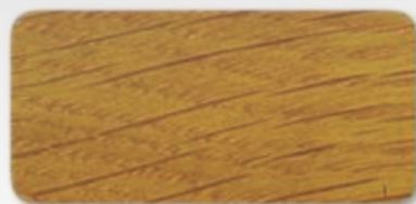
WS 107 Tobacco