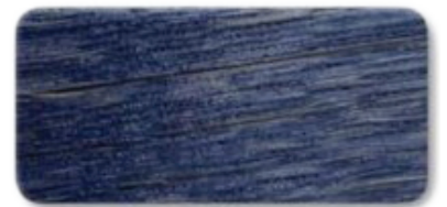
WS 156 Parliament Blue