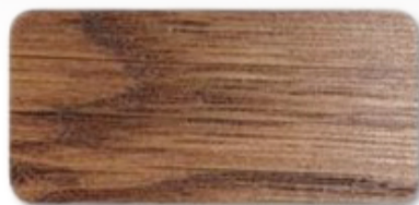
WS 190 Dark Mahogany