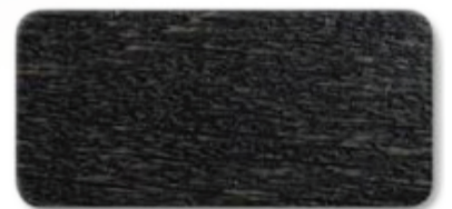
WS 150 Black