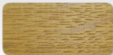
WS 154 Yellow