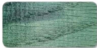
WS 158 Green