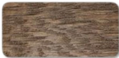
WS 187 Dark Walnut