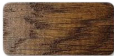
WS 193 Nut