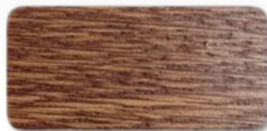
WS 188 Brown Mahogany